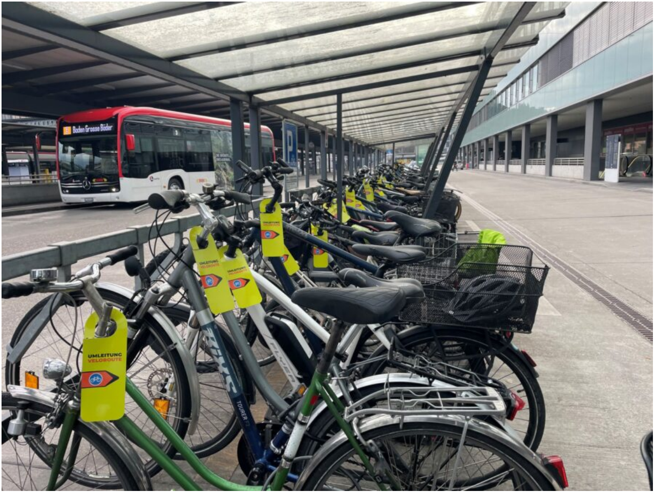
Informationsaktion am 18. Dezember 2024