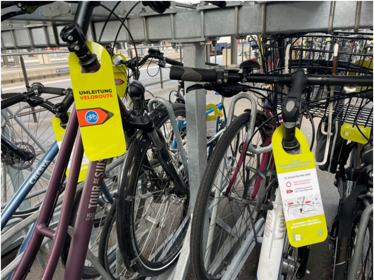
Information der Velofahrenden mit "Velohängern"